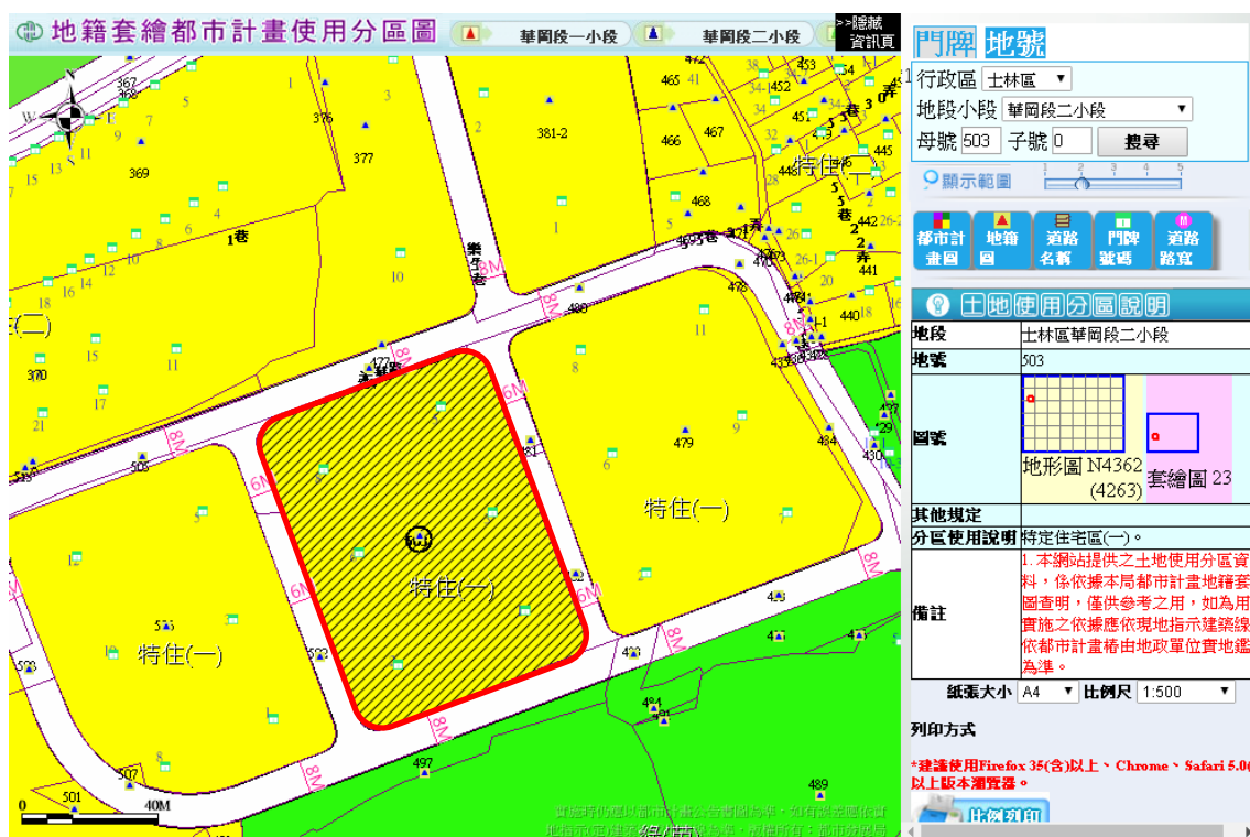
圖 1. 位於陽明山美軍宿舍群 C-2 區之 C484 建物位置 (上圖 / 圖釘標示)、所屬街廓 (紅框區域 / 建築基地範圍) 及周邊環境之土地使用分區說明 (下圖 / 環境模型範圍)。