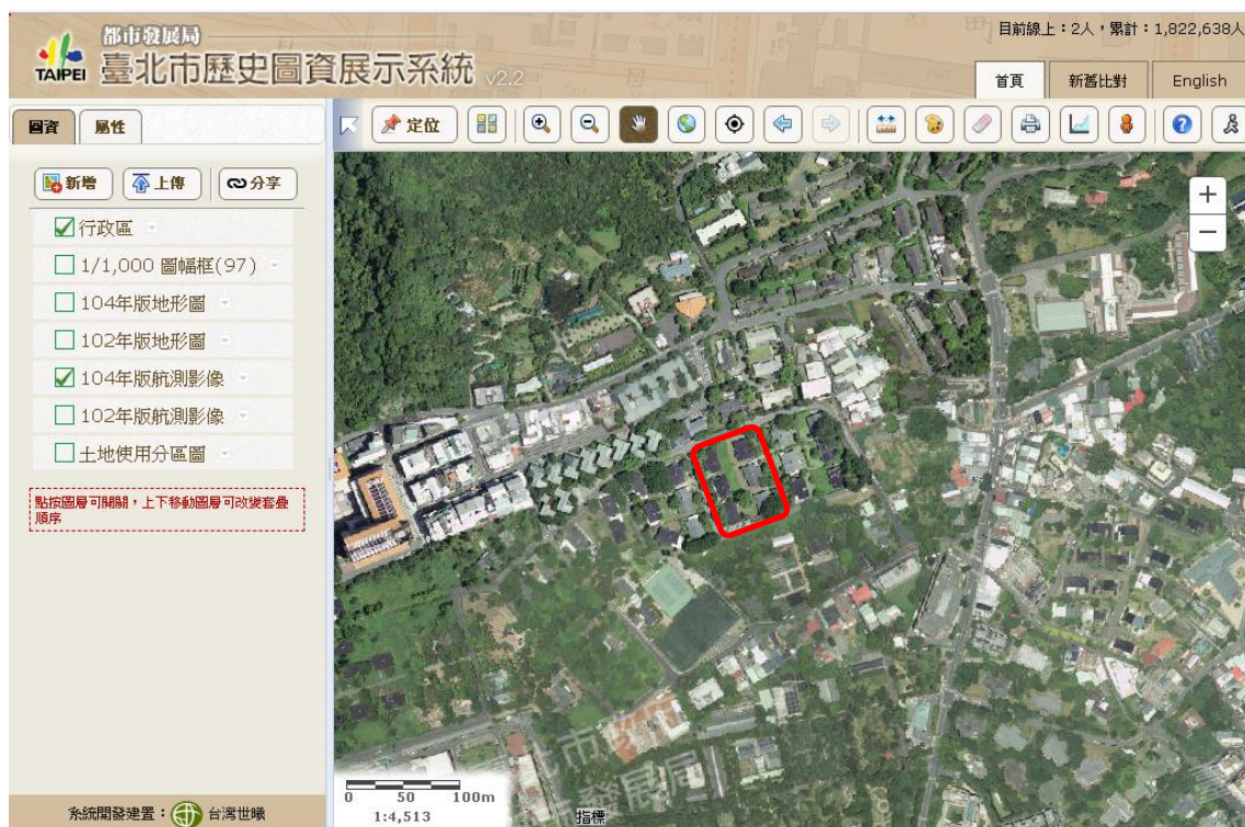
圖 2. 建築基地與周遭環境之地形圖（上圖）與航測影像（下圖） 6 。